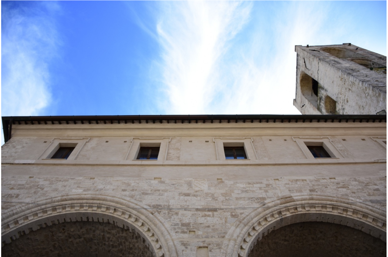
Città di NARNI - Particolare Palazzo dei Priori